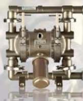
SaniForce 1040 38 mm (1,5")