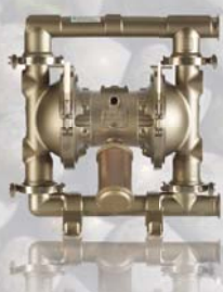
SaniForce 1590 50,8 mm (2")