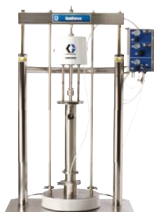
SaniForce 5:1 Urządzenie do rozładowywania zbiorników