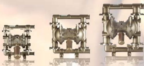
SaniForce 1040 38 mm (1,5")