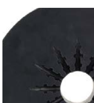
20 l (5 galonów)