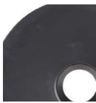
200 l (55 galonów)