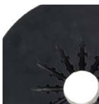
20 l (5 galonów)