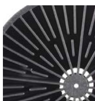
200 l (55 galonów)