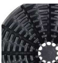
20 l (5 galonów)