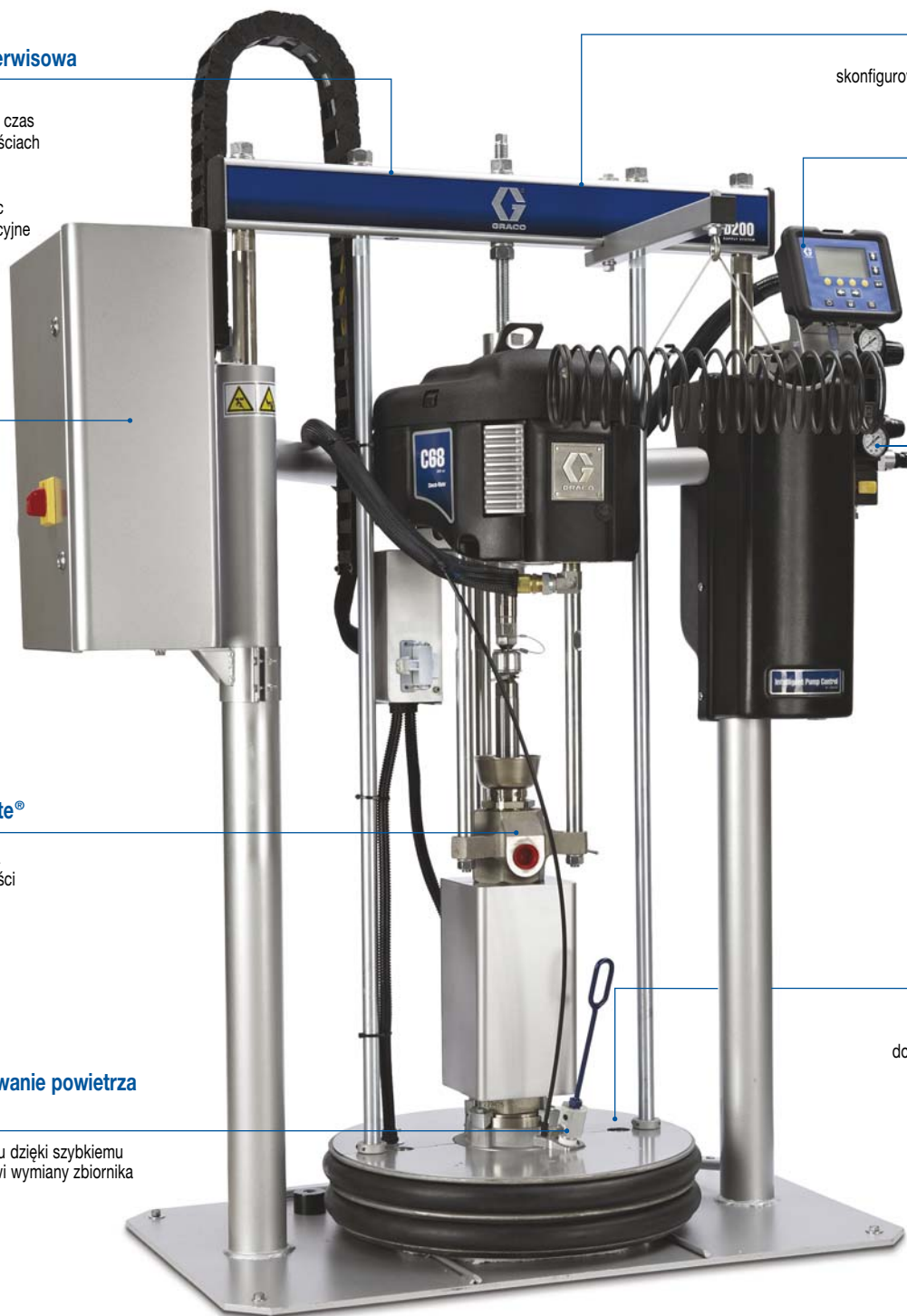
System tłoczenia materiałów topionych na gorąco firmy Graco